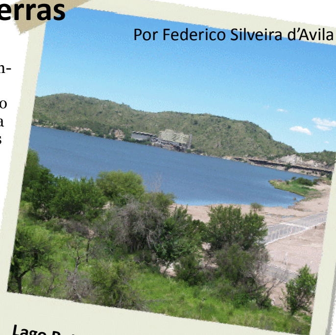
Lago Potrero de los Funes - San Luis

sarán, apagando sus linternas y quedarán maravillados en el punto más profundo y más oscuro de la caverna.